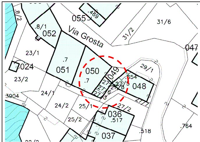
Estratto Mappa con N. unità edilizia