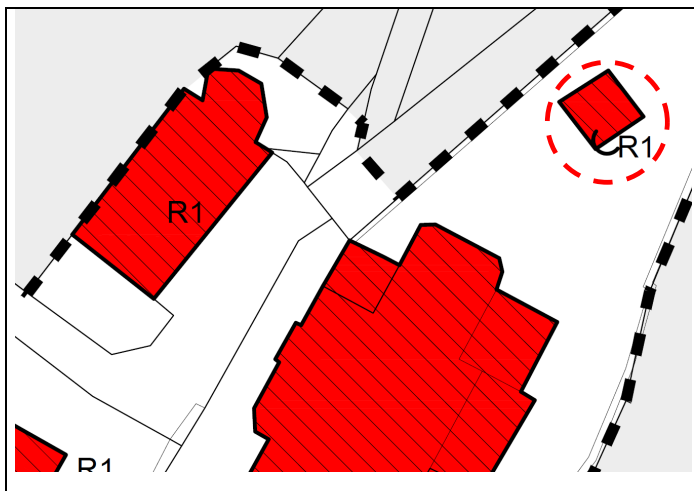
Estratto Zonizzazione Insediamento Storico