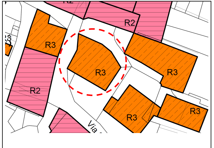
Estratto Zonizzazione Insediamento Storico