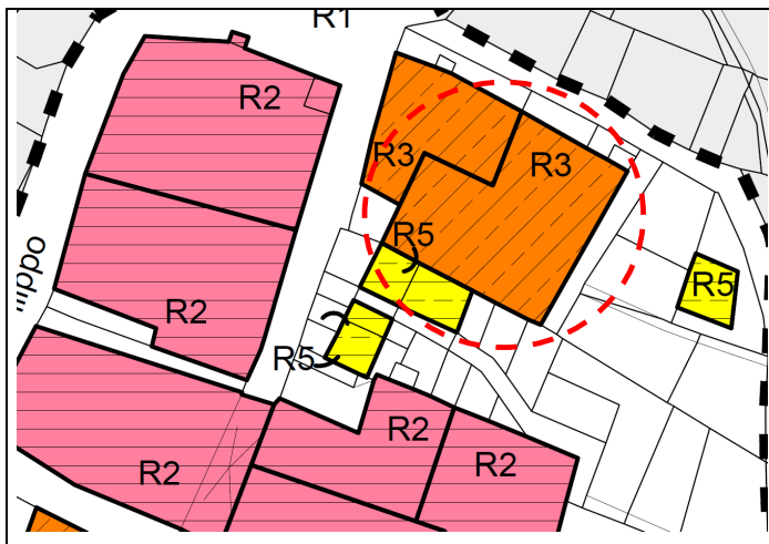
Estratto Zonizzazione Insediamento Storico