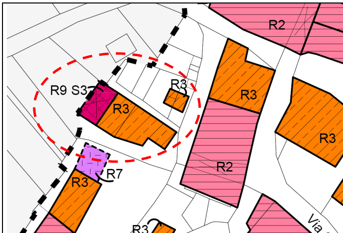
Estratto Zonizzazione Insediamento Storico