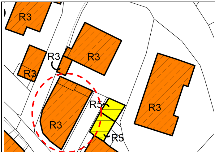
Estratto Zonizzazione Insediamento Storico