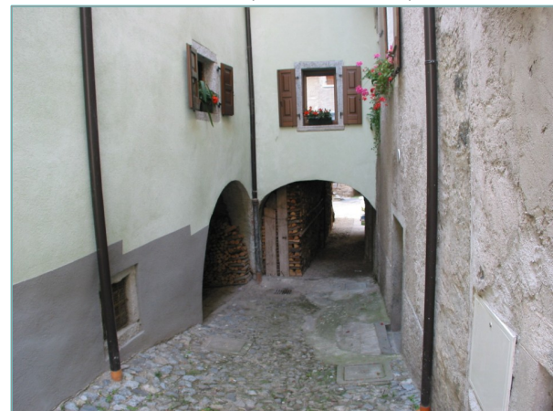
- particolare androni a piano seminterrato -