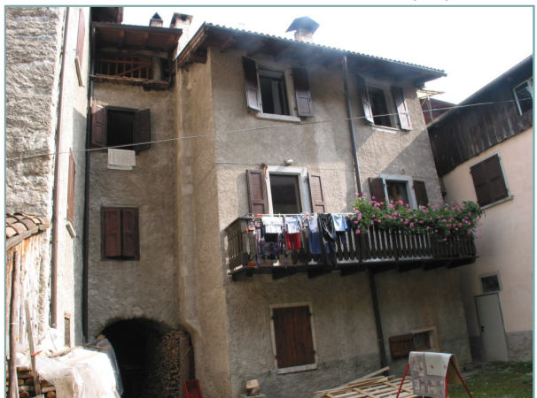
- prospetto ovest -