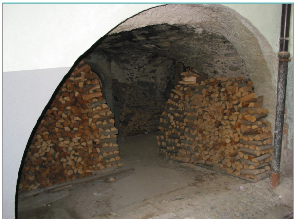
- particolare androne a piano seminterrato -