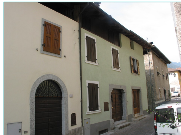
- prospetto est -