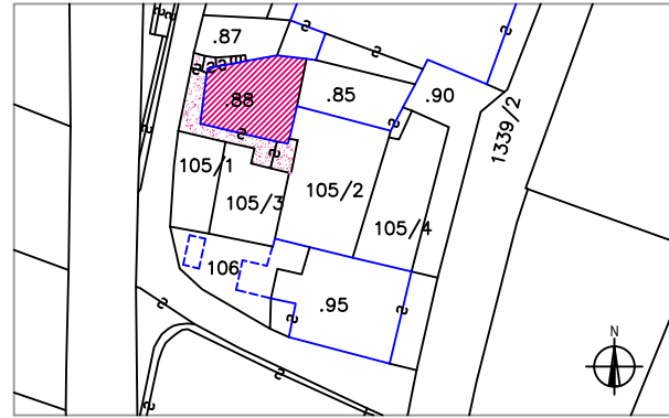
Estratto mappa catastale 1:1.000

Data del rilievo settembre 2004 Rilevatore arch. Ruggero Doma arch. Sebastiano Bertolini Comune Catastale Lardaro I° Foglio di Mappa 12 Part. edif. 88