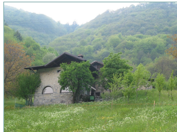
- prospetto sud-est -