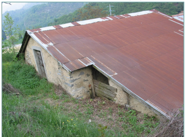
- prospetto nord-ovest -