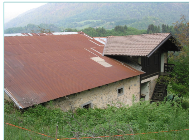
- prospetto sud-ovest -