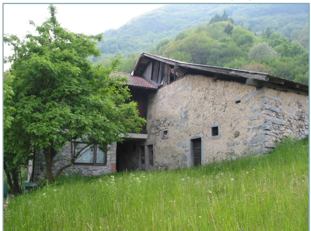
- prospetto sud-est -