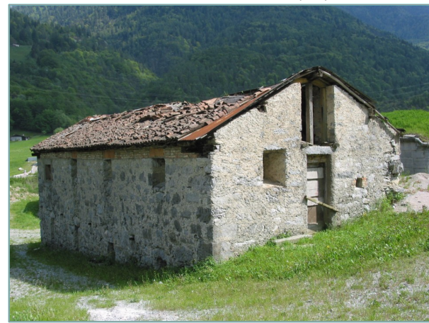
- prospetti nord e ovest -