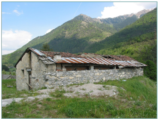
- prospetti ovest e sud -