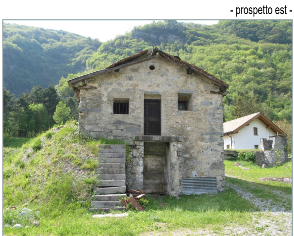
- prospetto est -