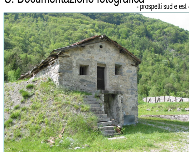
- prospetti sud e est -