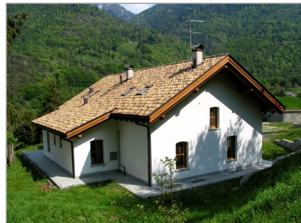
- prospetti nord e ovest -