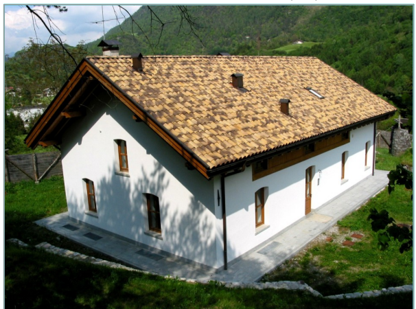
- prospetti ovest e sud -