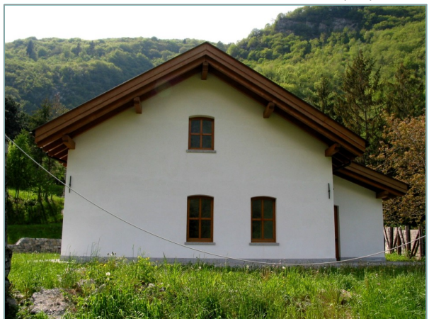
- prospetto est -