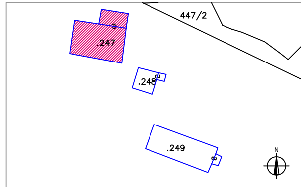
Estratto mappa catastale 1:1.000

Data del rilievo Rilevatore Comune Catastale Foglio di Mappa Part. edif.