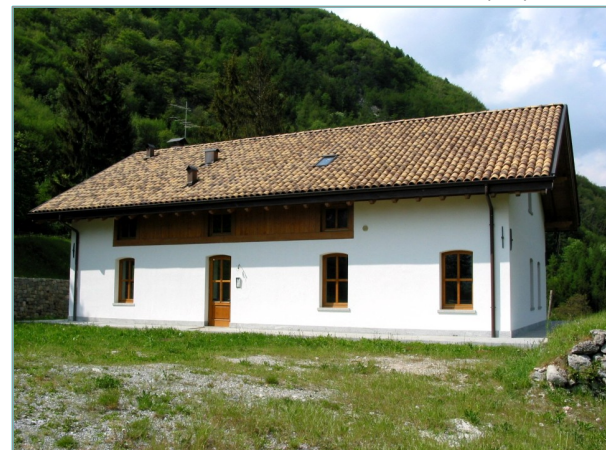
- prospetto sud -