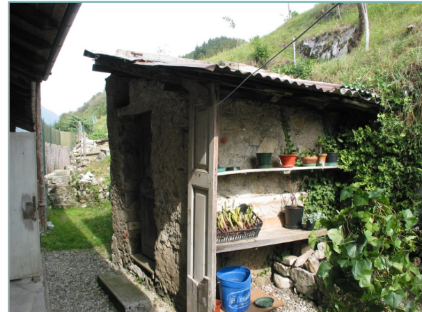
- vista dall'alto -