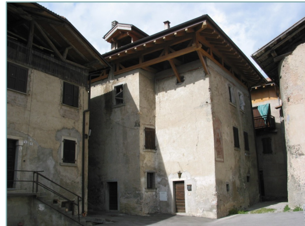
- prospetti sud e est -