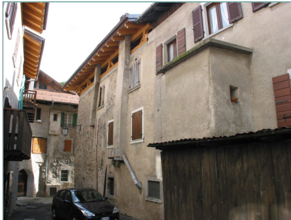
- prospetto nord -