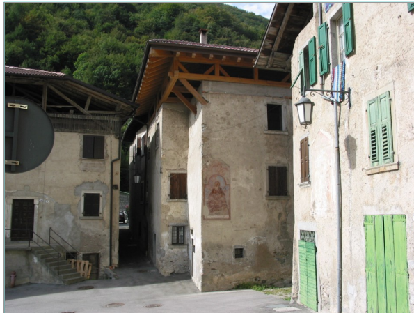
- prospetti sud e est -