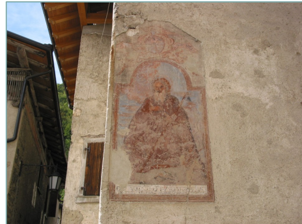
- particolare affresco in prospetto est -