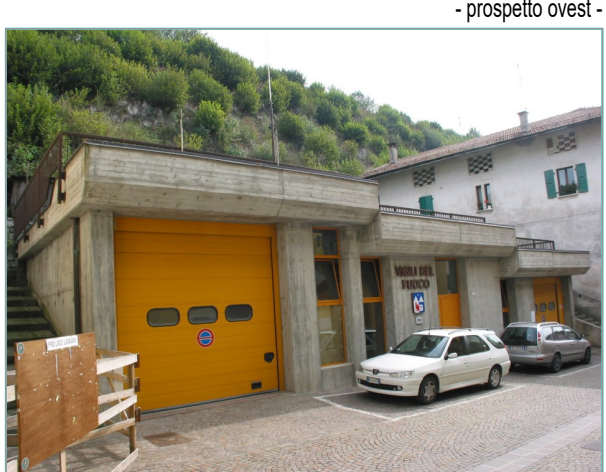
- prospetto ovest -