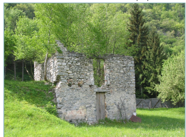
- prospetti sud e est -