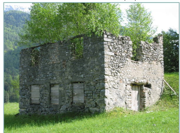
- prospetti nord e ovest -