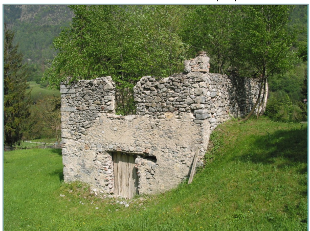
- prospetti ovest e sud -