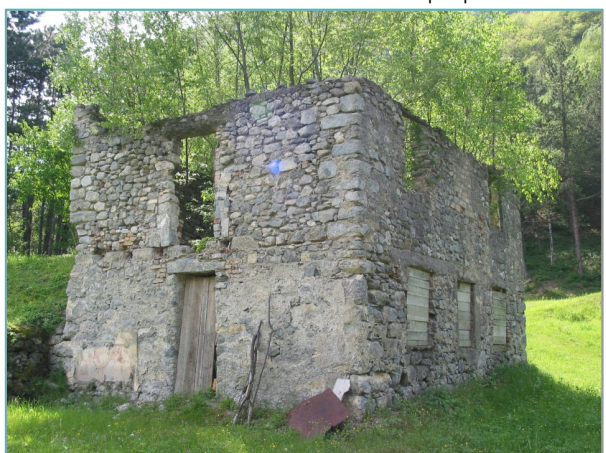
- prospetti est e ovest -