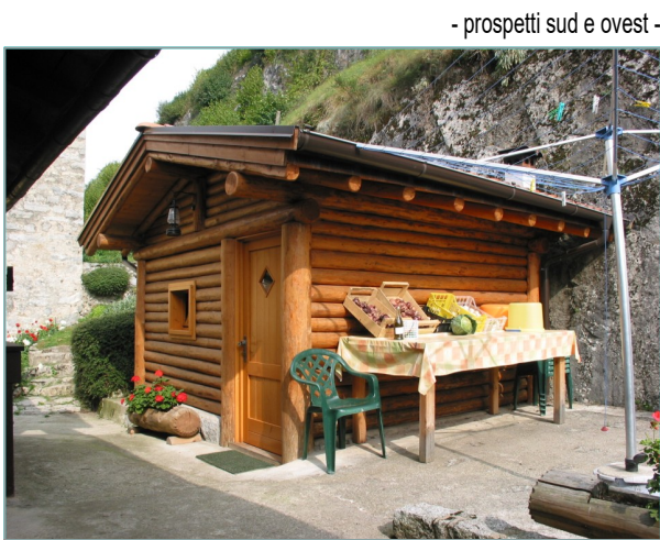
- prospetti sud e ovest -