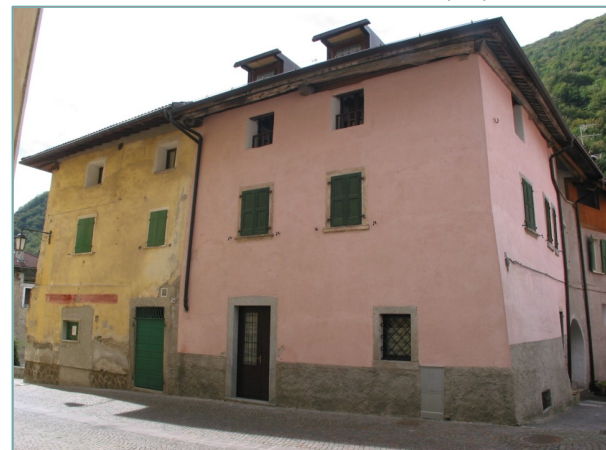
- prospetti est e nord -