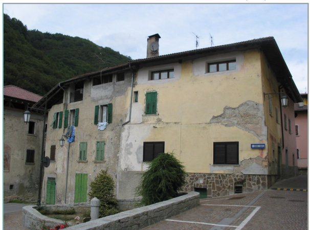
- prospetto sud -