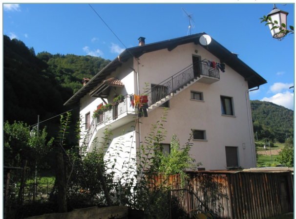
- prospetto est -