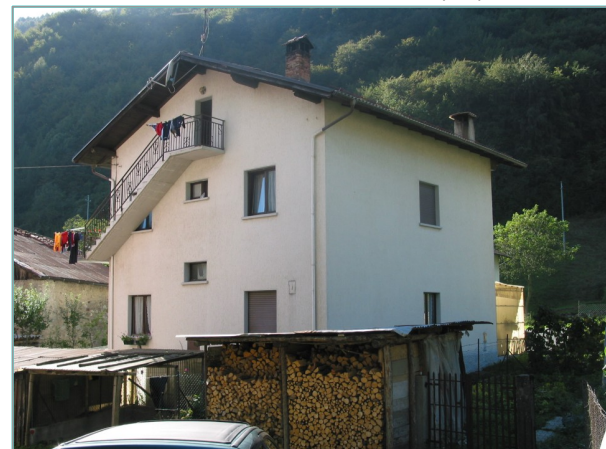
- prospetti nord e est -