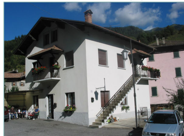
- prospetti sud e ovest -