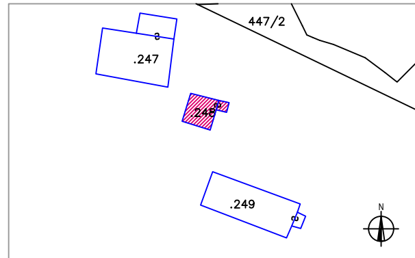
Estratto mappa catastale 1:1.000