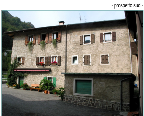
- prospetto sud -