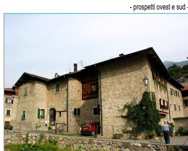
- prospetti ovest e sud -