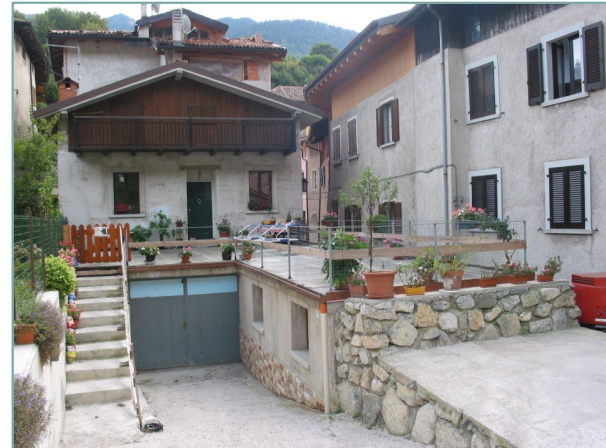
- prospetto ovest -