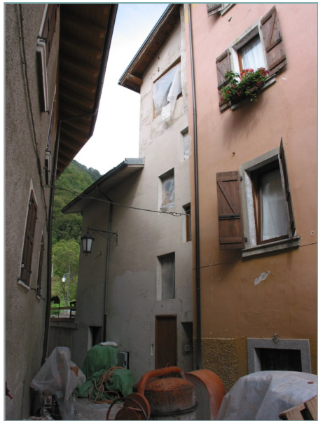
- prospetto sud -