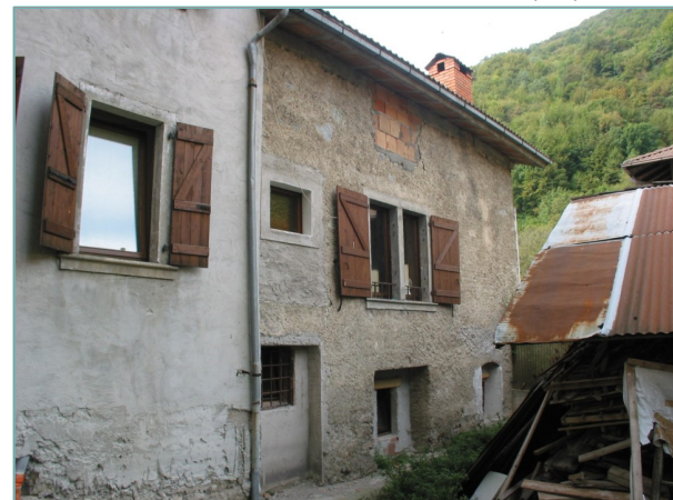
- prospetto nord -