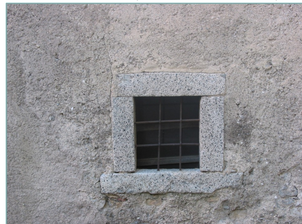
- particolare finestra con contorni in pietra -