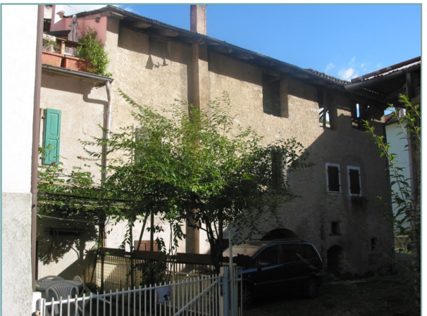
- prospetto ovest -