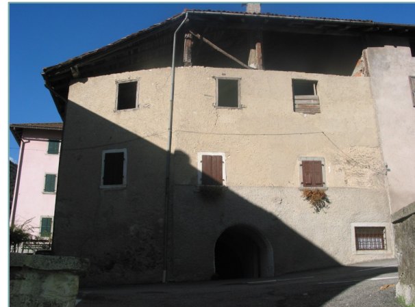
- prospetto sud -