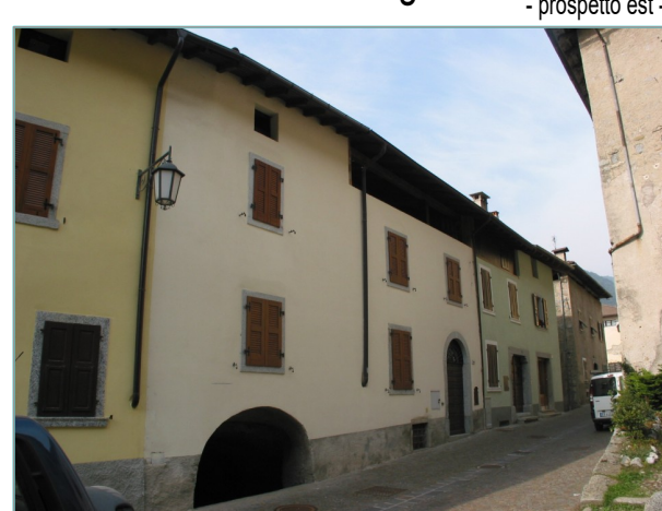
- prospetto est -