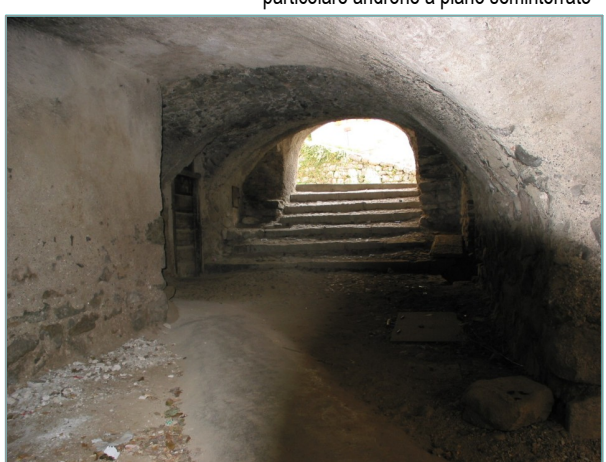
- particolare androne a piano seminterrato -