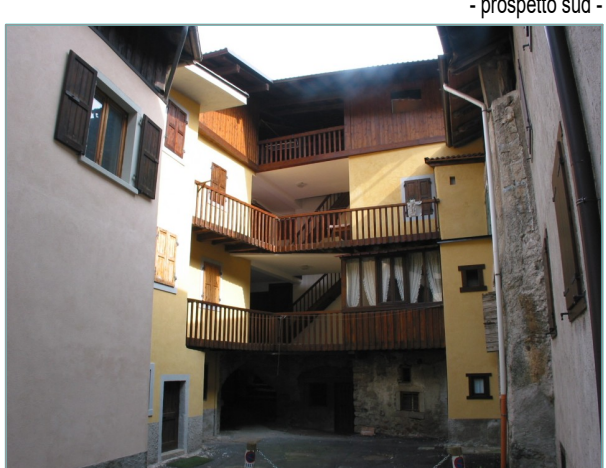
- prospetto sud -