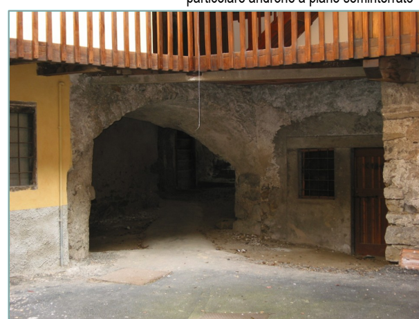
- particolare androne a piano seminterrato -