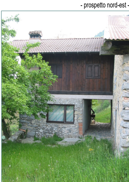
- prospetto nord-est -