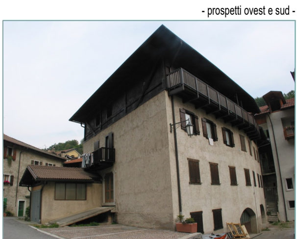
- prospetti ovest e sud -