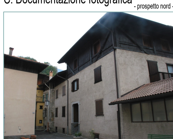
- prospetto nord -