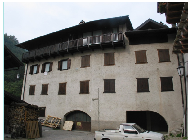
- prospetto sud -