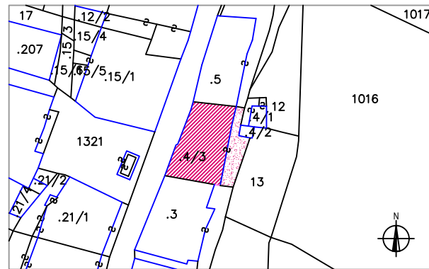
Estratto mappa catastale 1:1.000

Data del rilievo settembre 2004 Rilevatore arch. Ruggero Doma arch. Sebastiano Bertolini Comune Catastale Lardaro I° Foglio di Mappa 12 Part. edif. 4/3