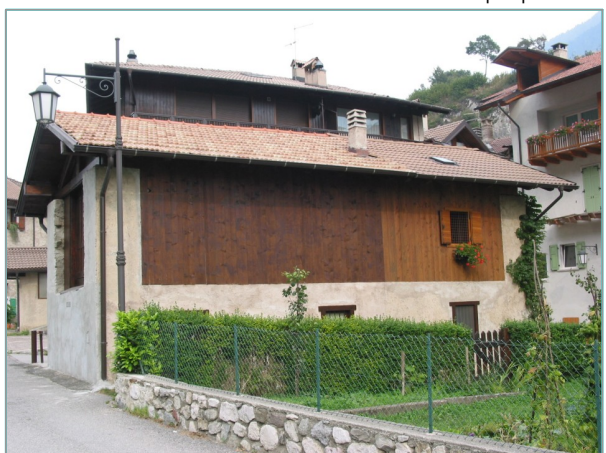
- prospetto est -