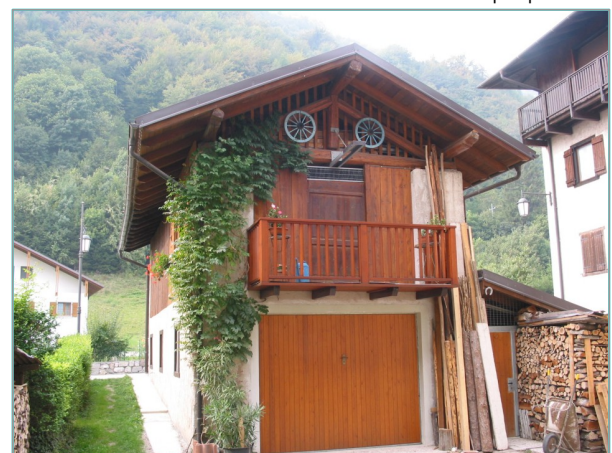
- prospetto est -