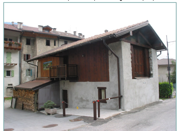
- particolare portale d'ingresso in prospetto est -