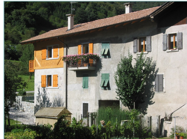
- prospetti nord e ovest -