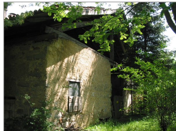
- prospetto ovest -