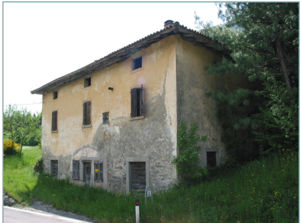
- prospetti est e nord -