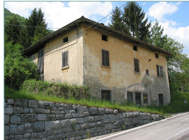
- prospetti sud e est -