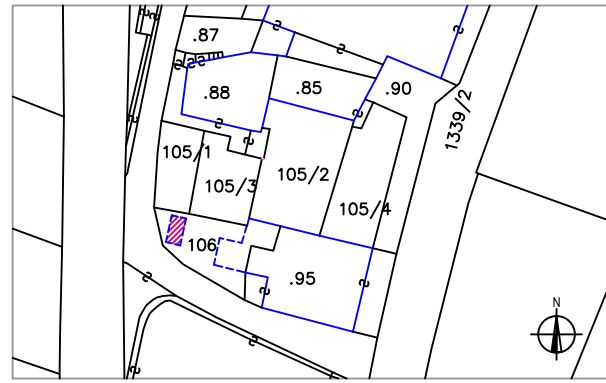
Estratto mappa catastale 1:1.000

Data del rilievo Rilevatore Comune Catastale Foglio di Mappa Part. fond.