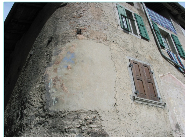
- particolare affresco in prospetto sud -