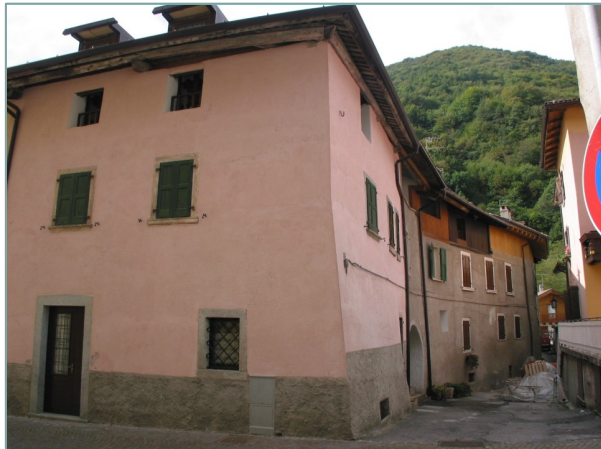
- prospetto nord -