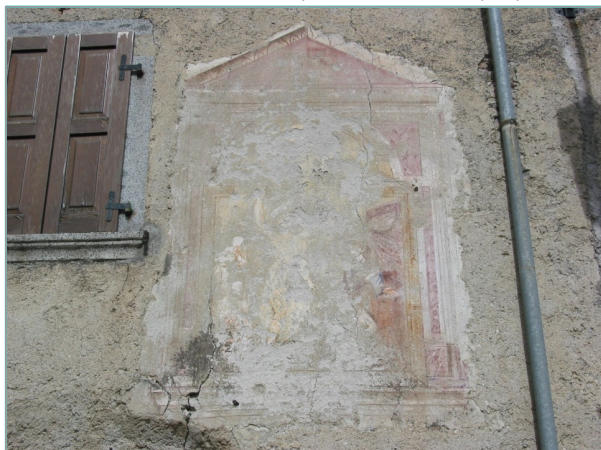
- particolare affresco in prospetto sud -