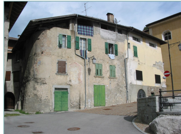
- prospetti sud e ovest -