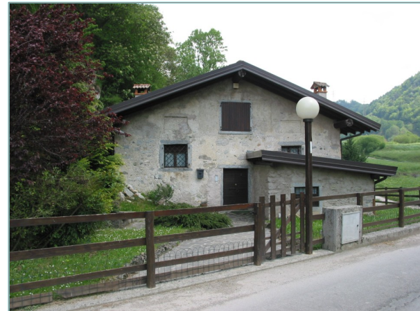
- prospetto sud -