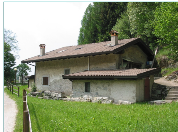
- prospetto est -