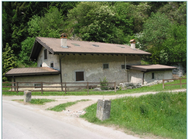
- prospetto est -