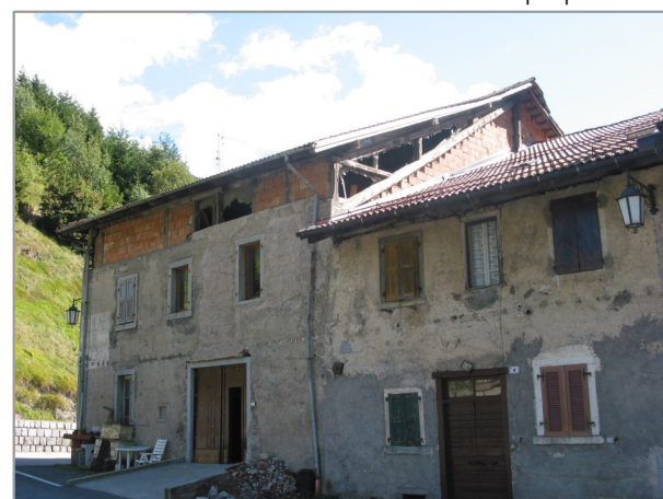
- prospetto est -