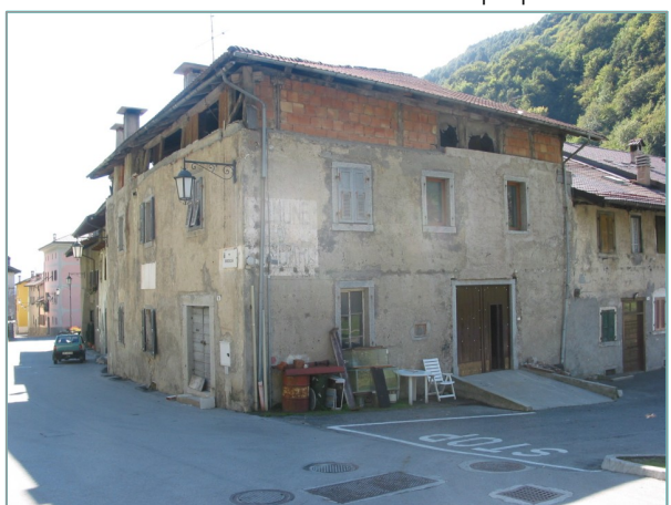
- prospetti nord e est -