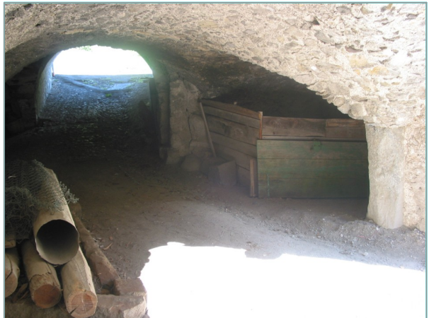
- particolare androne a piano seminterrato -