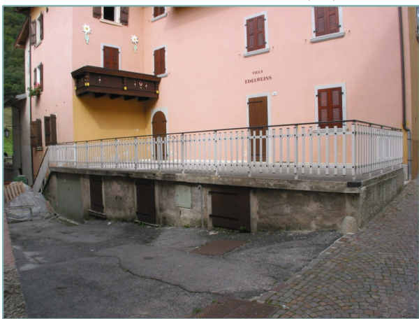
- prospetti sud e est -