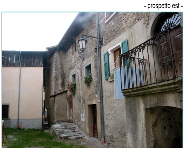
- prospetto est -