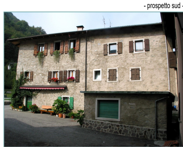
- prospetto sud -