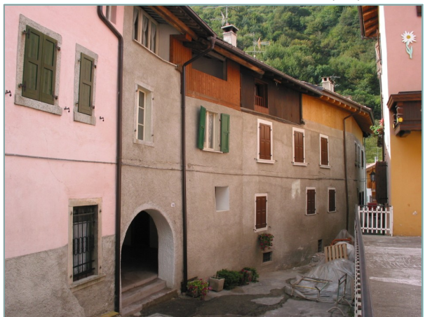
- prospetto nord -