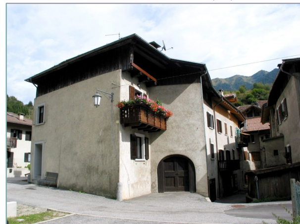
- prospetti ovest e sud -