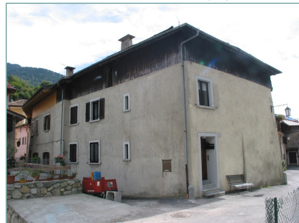
- prospetti nord e ovest -