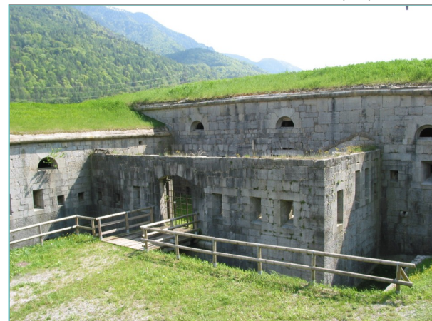
- prospetto nord -