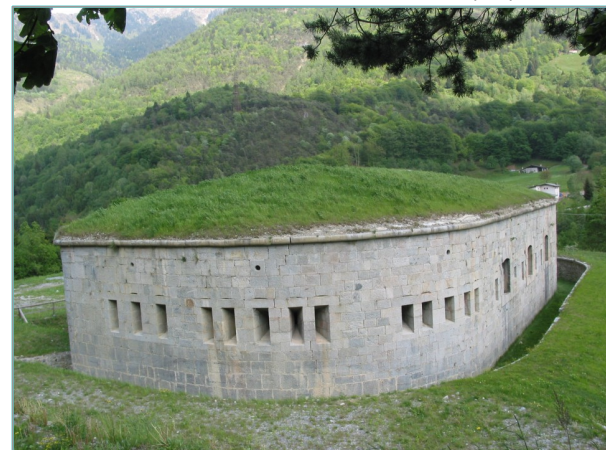
- prospetto ovest -