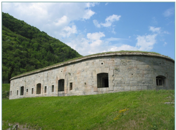
- prospetto sud -