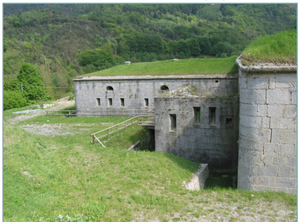
- prospetti ovest e nord -