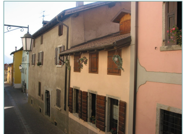
- prospetto est -