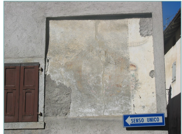
- particolare affresco -