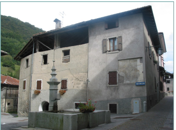
- prospetto sud -