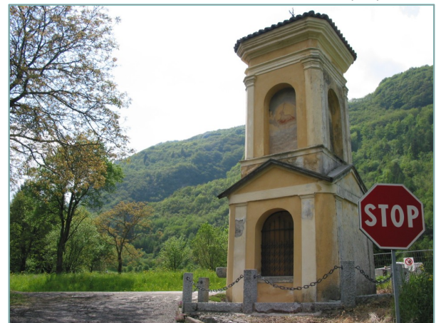
- prospetto est -