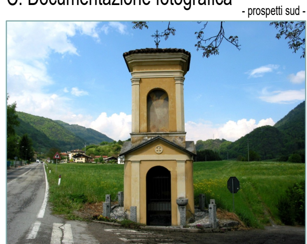
- prospetti sud -