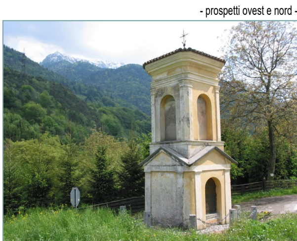
- prospetti ovest e nord -