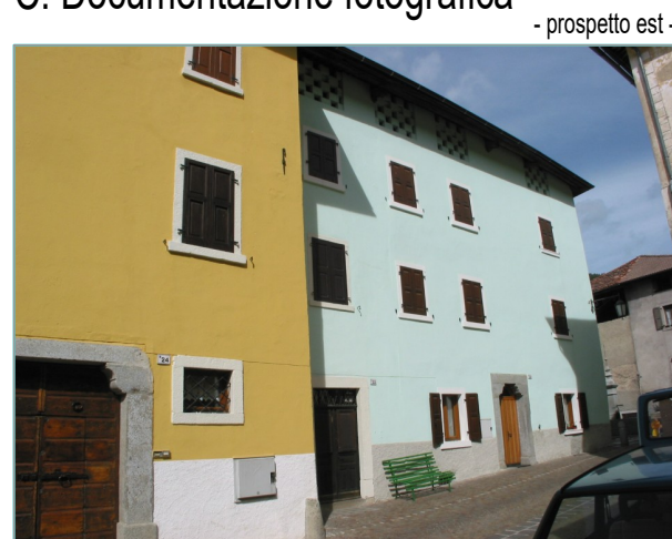
- prospetto est -