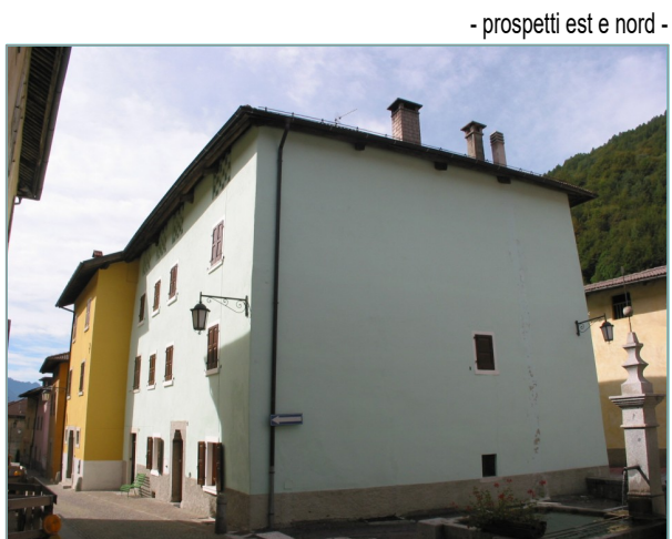
- prospetti est e nord -