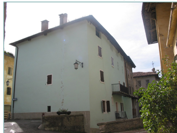
- prospetti nord e ovest -