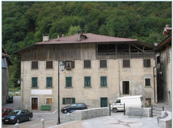
- prospetto est -