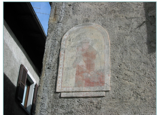
- particolare affresco in prospetto ovest -