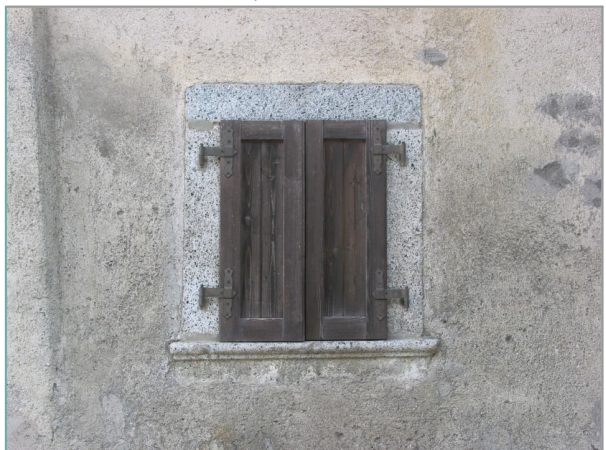
- particolare finestra con contorni in tonalite -