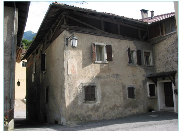
- prospetti nord e ovest -