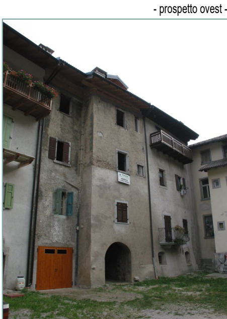
- prospetto ovest -