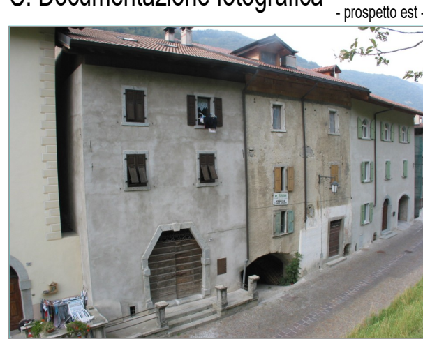
- prospetto est -