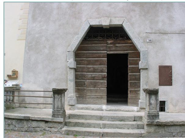
- particolare portale d'ingresso in prospetto -