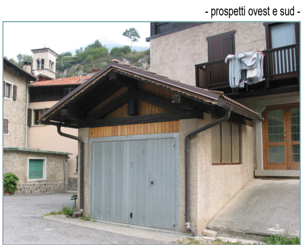
- prospetti ovest e sud -