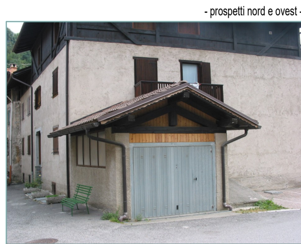
- prospetti nord e ovest -