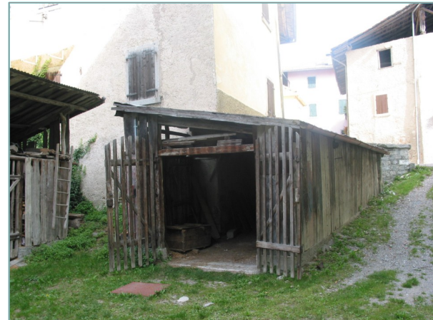
- prospetto sud -