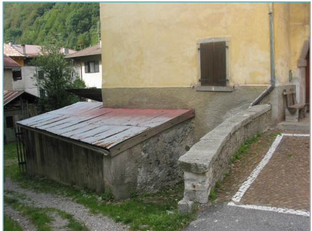
- prospetti nord e est -