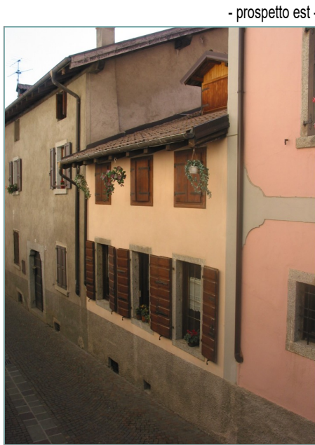
- prospetto est -