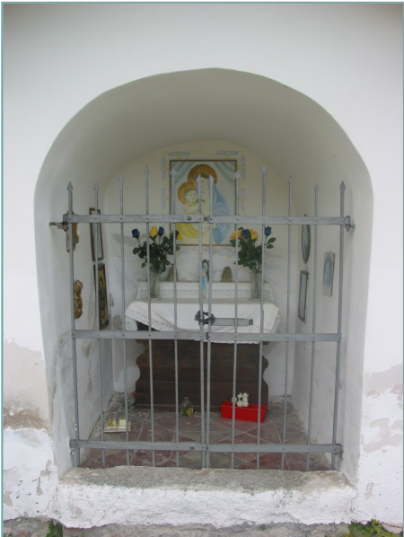
- particolare interno -