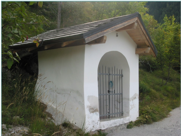
- prospetti ovest e sud -