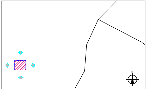
Punto di vista della foto ( ) 1:1.000