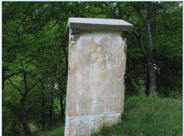
- prospetto est -