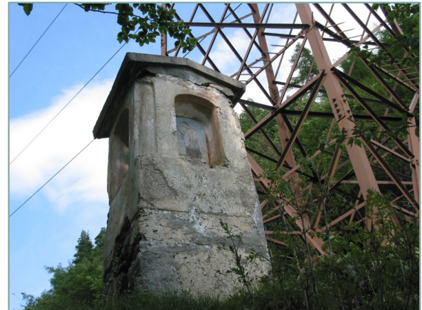
- prospetto sud -