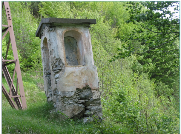
- prospetto ovest -