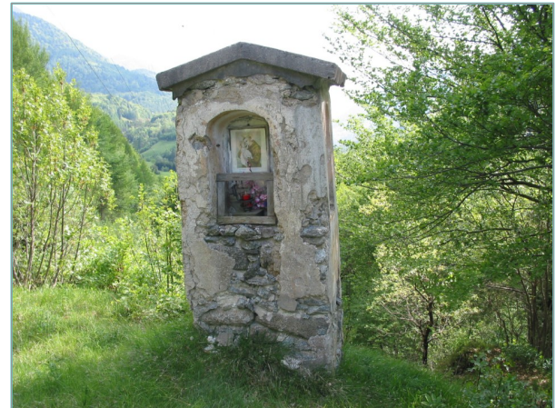
- prospetto nord -