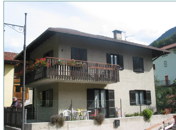
- prospetti sud e ovest -