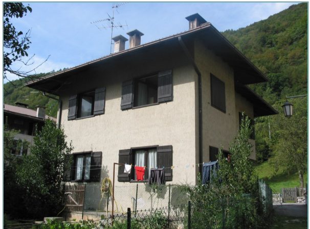
- prospetti est e nord -