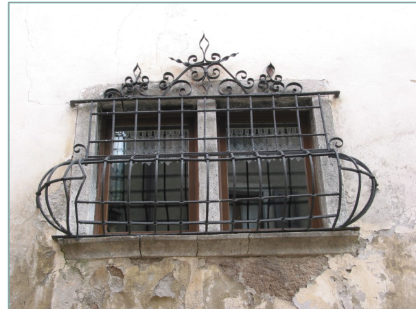
- particolare bifora in prospetto ovest -