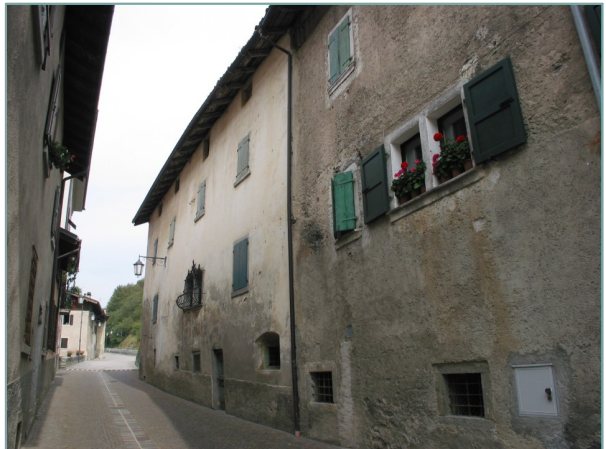
- prospetto ovest -