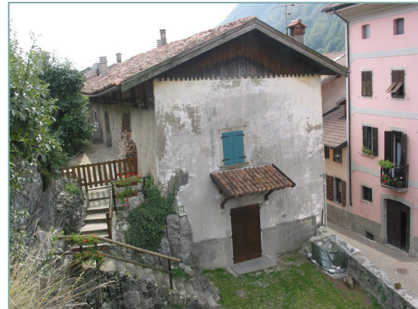
- prospetti nord e est -