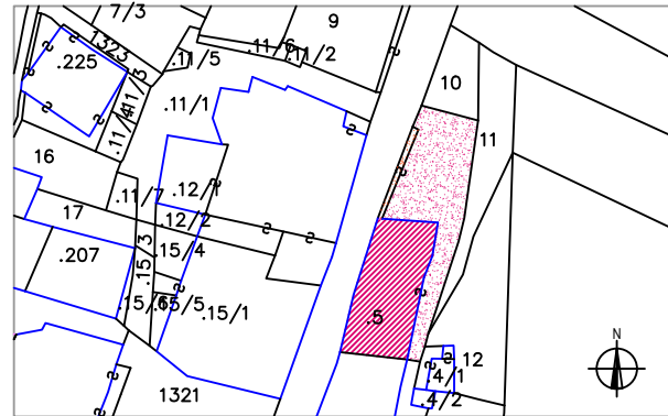
Estratto mappa catastale 1:1.000

Data del rilievo settembre 2004 Rilevatore arch. Ruggero Doma arch. Sebastiano Bertolini Comune Catastale Lardaro I° Foglio di Mappa 12 Part. edif. 5