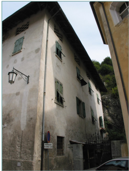
- prospetto sud -