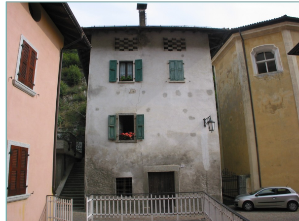
- prospetto ovest -