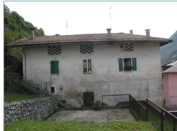
- prospetto nord -